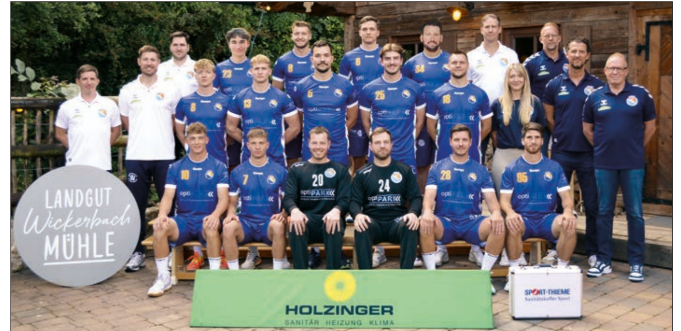
Wir danken der Wickerbachalm für die Bereitstellung der Location unserer Mannschaftsfotos.